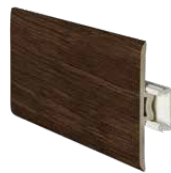
perfil de transição transition profile profilé de transition 2400 x 45 mm