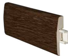
perfil de remate terminal end trim profile profilé terminal de finition 2400 x 45 mm