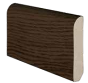
perfil de rodapé baseboard profile profilé de plinthe 2400 x 60 x 12 mm