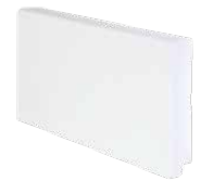
perfil de rodapé branco 70 x 14 white baseboard profile 70 x 14 profilé de plinthe 70 x 14 2200 mm