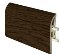
perfil de desnível gap profile profilé d'ecart 2400 x 45 mm