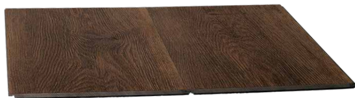
SAGIFLOOR 1220 x 183 x 6 mm