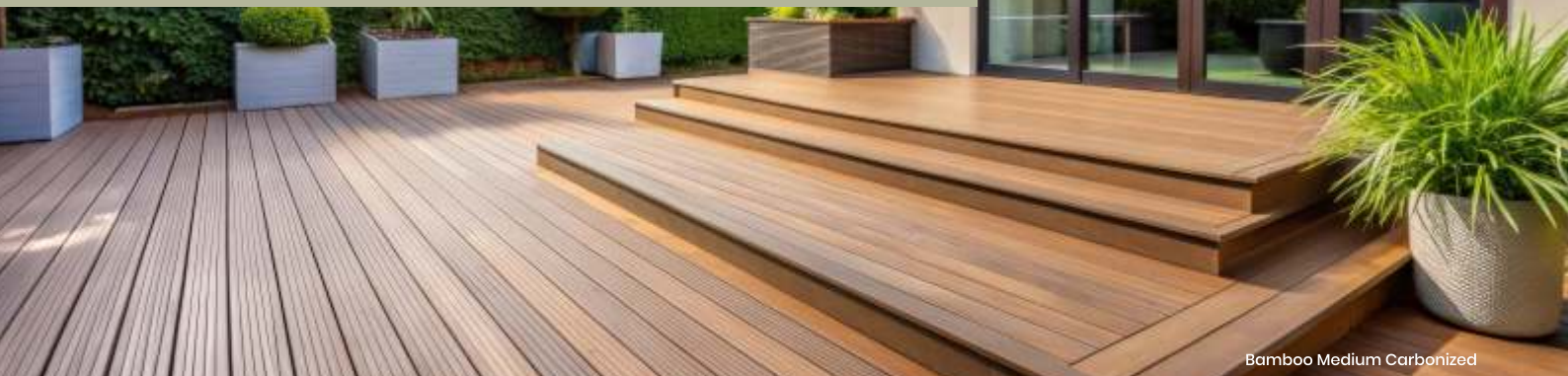
Bamboo Medium Carbonized

Os produtos outdoor de bambu são adequados para aplicações no exterior, especialmente para decks e apresentam-se como uma opção mais sustentável. Têm inúmeras vantagens como a alta densidade (1200kg/m 3 ), a durabilidade (Classe 1), a impermeabilidade, anti-mofo, anti-corrosão e resistência ao deslizamento.