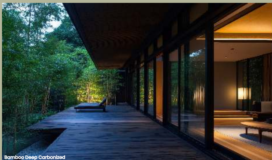
Bamboo Deep Carbonized